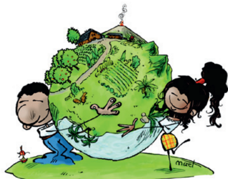
L'avenir de l'île et le nôtre sont entre nos mains

incitait les citoyens à «faire leur part» pour le changement de société auquel ils aspirent... La fin de l'histoire du colibri, mort d'épuisement sans avoir pu éteindre l'incendie faute d'avoir su mobiliser les autres animaux de la forêt, est riche d'enseignement. Pour sa dimension délibérément très collective tournée vers le Présent et l'Avenir «Oasis Réunion» avait été qualifiée par Pierre d' «entreprise humaine géniale» lors d'un long entretien avec lui, peu de temps avant qu'il ne retourne à la Terre Mère (2) .