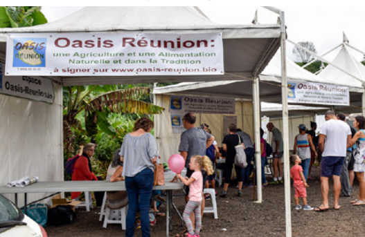
▼ Journée d'info au Tampon

chaque année par les 860 000 habitants et visiteurs.