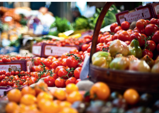
▼ Marché bio à La Réunion

au plan individuel comme au plan collectif, en pensant très intensément que tout est possible si nous le portons dans le corps, dans le cœur, et dans l'âme. Il y a encore quelques années je n'aurais pas pu tenir ce discours en partie dématérialisé, pour expliquer ce que doit être délibérément l'action collective.