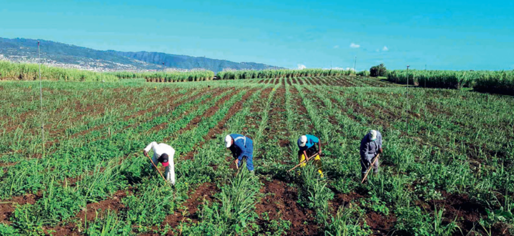
▲ Canne bio, premier essai à la mare